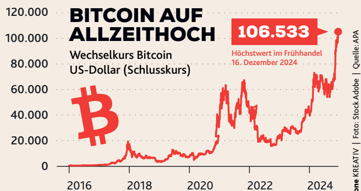
Krone KREATIV | Foto: Stock-Adobe | Quelle: APA

Rechnet man noch, dass ab Jänner die Strompreis-Bremse beendet wird und Elektrizitäts- sowie Erdgasabgabe steigen, so wird die Energierechnung wohl für alle Verbraucher spürbar höher. Christian Ebeert